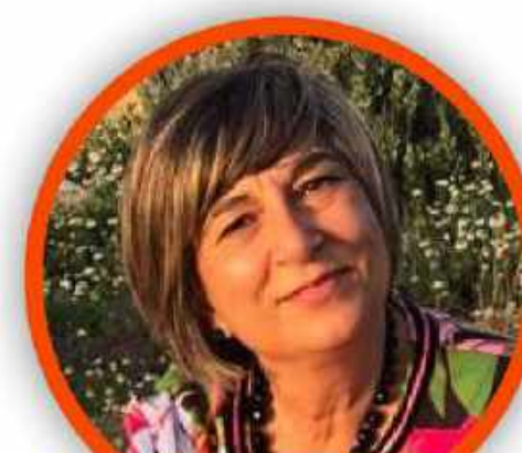
GIOVANNA MARIA BURRELLI SCUOLA PRIMARIA