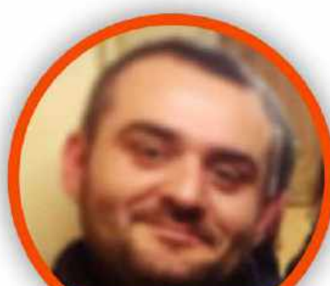
ROBERTO ZOLLO SCUOLA PRIMARIA