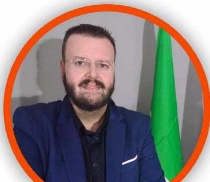
GIUSEPPE FAVILLA SECONDARIA DI SECONDO GRADO

DOCENTI, ATA, INSEGNANTI DI RELIGIONE PER LA SCUOLA